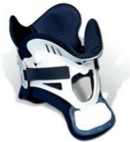
Miami J brace