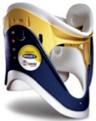
Harde hals kraag