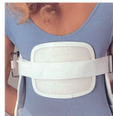
Afbeelding 3 Jewett brace